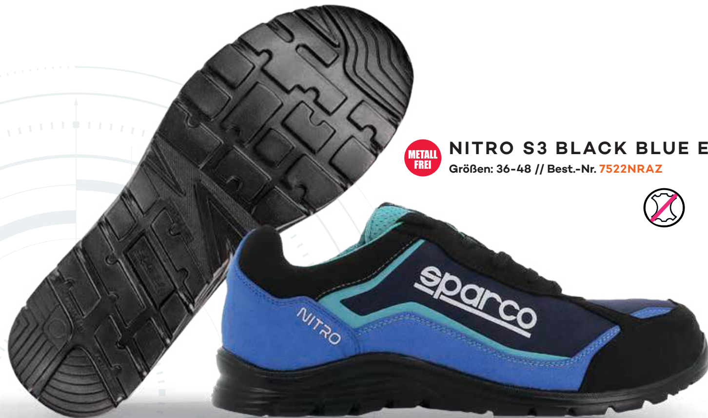
NITRO S3 BLACK BLUE ESD Größen: 36-48 // Best.-Nr. 7522NRAZ